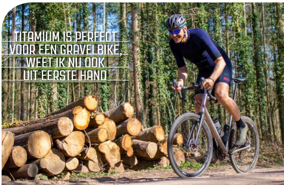
De Rowtag, mijn ultieme speel-fiets.

Ik wilde per se een dubbel crankstel, om achter een vrij vlakke cassette te kunnen gebruiken zonder grote tussenstappen. Dat is mijn persoonlijke voorkeur; met hetzelfde gemak laat je de voorderrailleur